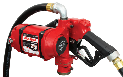
Конфигурация с креплением в отверстии NX25-120NB-AA