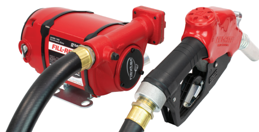
Конфигурация с креплением на лапах NX25-120NF-AA